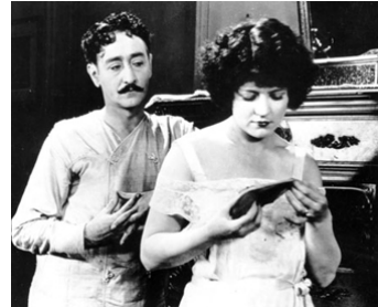
1923 COMÉDIENNES (The Marriage Circle) d'Ernst Lubitsch avec Adolphe Menjou