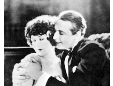
1924 FILLE DE PLAISIRS (Daughter of Pleasure) de William Beaudine avec Monte Blue