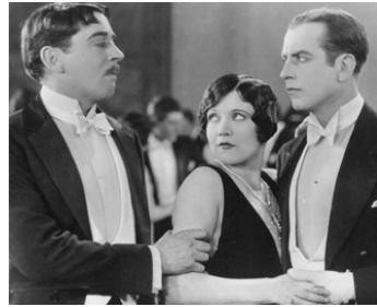
1921 MOONLIGHT FOLLIES de King Baggot avec George Fisher, Clyde Filmore