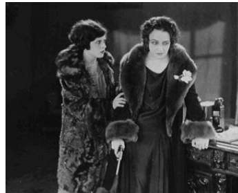
1924 TROIS FEMMES (Three Women) d'Ernst Lubitsch avec May McAvoy