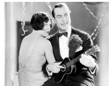
1925 HIS JAZZ BRIDE d'Herman C. Raymaker avec Matt Moore