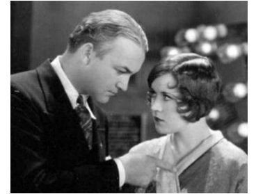
1929 LE FOU VOLANT (The Flying Fool) de Tay Garnett avec William Boyd