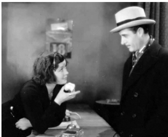
1930 GENTLEMAN'S FATE de Mervyn LeRoy avec John Gilbert