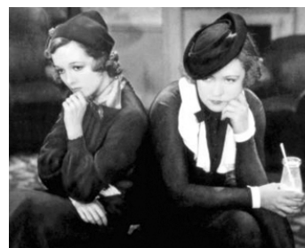
1935 TANGO (Tango) de Phil Rosen avec Marian Nixon