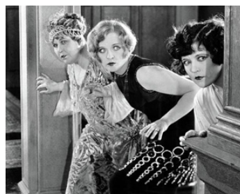
1926 UP IN MABEL'S ROOM d'E. Mason Hopper avec Maude Truax, Phyllis Haver