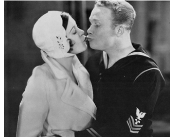
1930 SWEETHEARTS ON PARADE de Marshall Neilan avec Ray Cooke