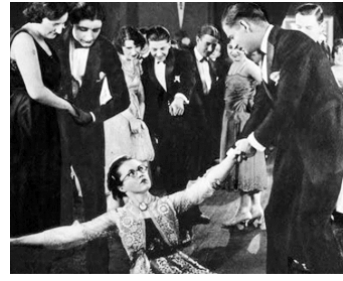
1921 NOBODY'S FOOL de King Baggot avec Harry Myers, Vernon Snively