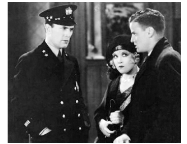
1928 LE RACKET (The Racket) de Lewis Milestone avec Thomas Meighan, Pat Collins