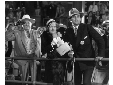
1931 PUR SANG (Sporting Blood) de Charles Brabin avec Hallam Cooley