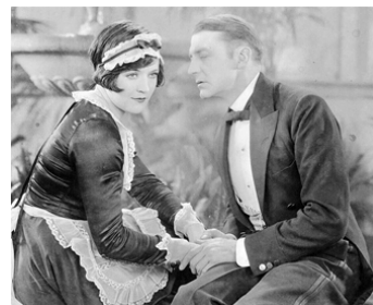
1925 SEVEN SINNERS de Lewis Milestone avec Clive Brook