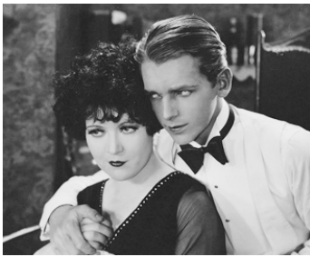
1927 MAN BAIT (Man Bait) de Donald Crisp avec Douglas Fairbanks Jr