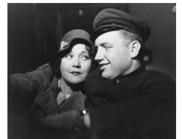
1931 THREE WISE GIRLS de William Beaudine avec Andy Devine