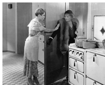
1933 PAROLE GIRL d'Edward F. Cline avec Mae Clarke