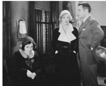
1931 IT'S A WILD CHILD de Robert Z. Leonard avec Marion Davies, Sidney Blackmer