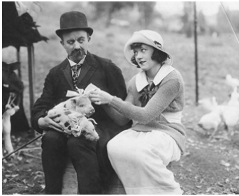
1918 ENTRE DEUX AVERSES (His hidden Purpose) d'Edward F. Cline avec Chester Conklin