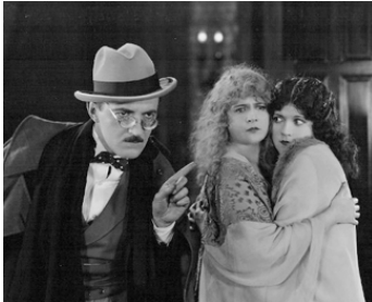
1923 RED LIGHTS de Clarence G. Badger avec Raymond Griffith, Alice Lake