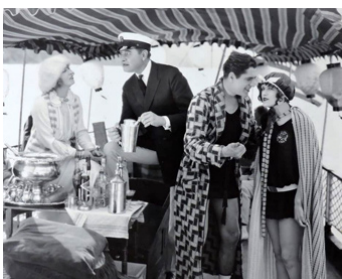
1925 OTHER WOMEN'S HUSBANDS d'Erle C. Kenton avec Phyllis Haver, Monte Blue