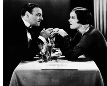
1930 FEMMES DE LUXE (Ladies of Leisure) de Frank Capra avec Lowell Sherman