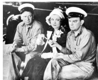
1931 LES TITANS DU CIEL (Hell Divers) de G. Hill avec Wallace Beery, Cliff Edwards