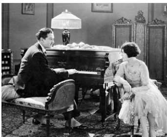
1925 MA FEMME ET SON FLIRT (Kiss me again) d'Ernst Lubitsch avec John Roche