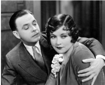
1929 DIVORCE MADE EASY de Neal Burns & Walter Graham avec Douglas MacLean