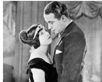
1924 THE LOVER OF CAMILLE d'Harry Beaumont avec Monte Blue