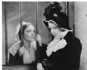
1931 LA FAUTE DE MADELEINE CLAUDET (The Sin of M Claudet) d'E. Selwyn avec Helen Hayes