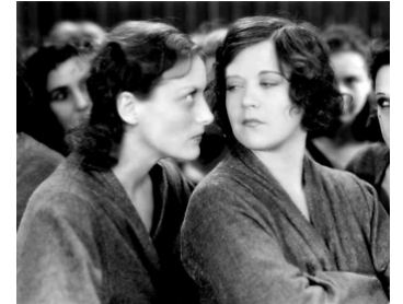
1930 IL FAUT PAYER (Paid) de Sam Wood avec Joan Crawford