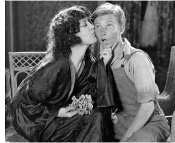
1922 LES HEROS DE LA RUE (Heroes of the Street) de William Beaudine avec Wesley Barry