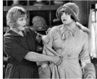
1929 LES DAMNÉS DU CŒUR (The godless Girl) de Cecil B. DeMille avec Lina Basquette