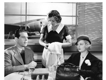
1936 13 HEURES DANS L'AIR (13 hours by air) de M. Leisen avec F. MacMurray, Joan Bennett