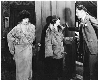
1924 L'ÉTREINTE DU PASSÉ (Tarnish) de George Fitzmaurice avec May McAvoy, Ronald Colman